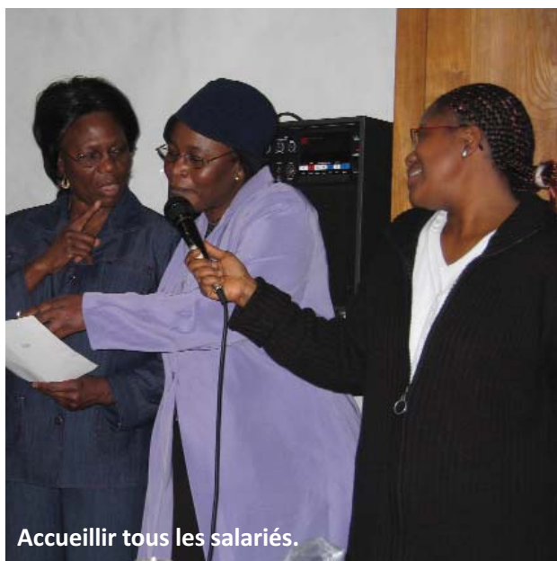
Accueillir tous les salariés.