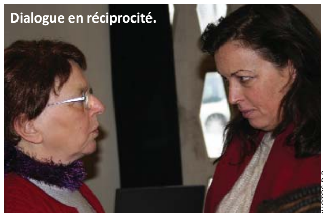
Dialogue en réciprocité.

L'œuvre d'évangélisation est alors pensée sous la forme du témoignage porté par chaque membre du mouvement. C'est encore aujourd'hui le titre du journal du mouvement !