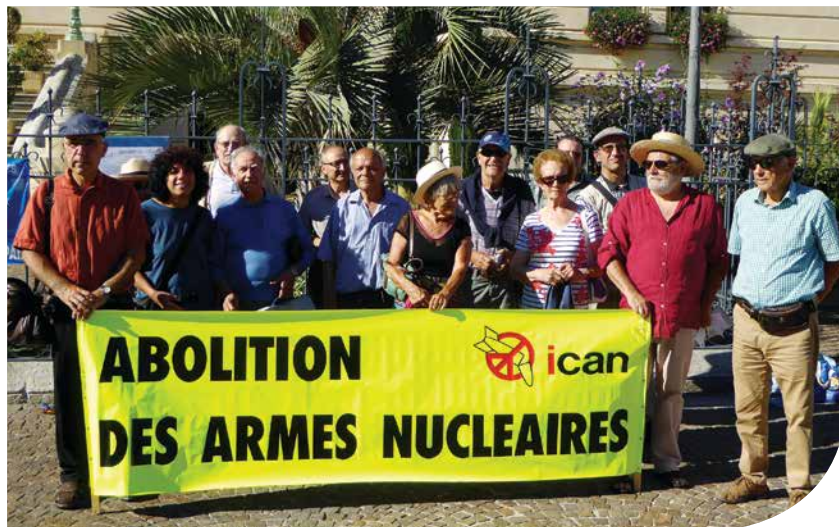
Un rassemblement du Collectif ICAN à Tarbes